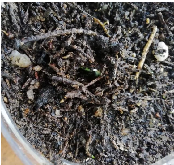
Fotografia tirada a 14/05/2020