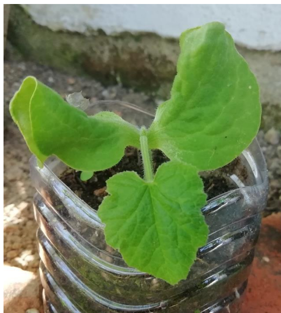
Fotografia tirada a 23/05/2020