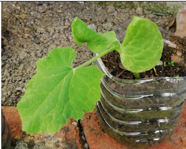
Fotografia tirada a 25/05/2020