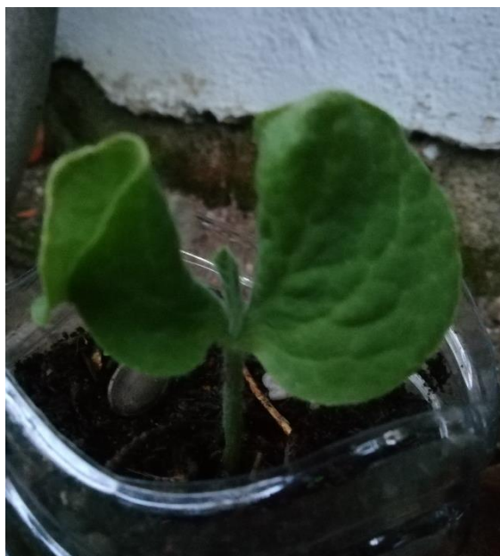
Fotografia tirada a 20/05/2020

Na terceira semana verificou-se o desenvolvimento de uma folha. A primeira, no dia 20 de maio, passados 15 dias da sementeira, mas que só se desenvolveu totalmente após 18 dias de ser semeada, dia 23 de maio. No dia 25 de maio começou a desenvolver-se a segunda folha.