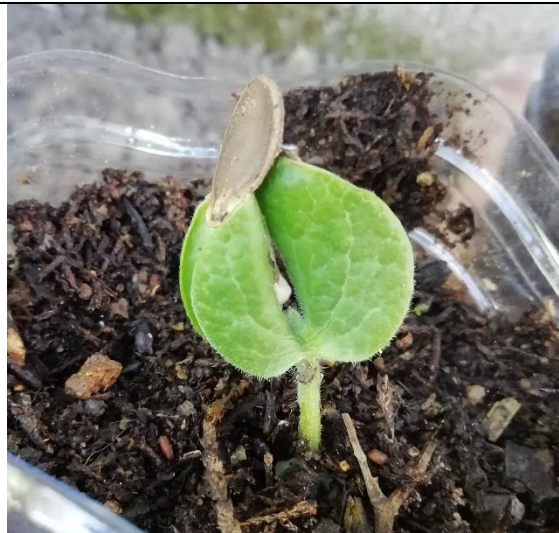
Fotografia tirada a 17/05/2020