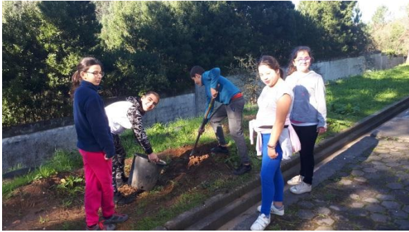
Trabalho em equipa