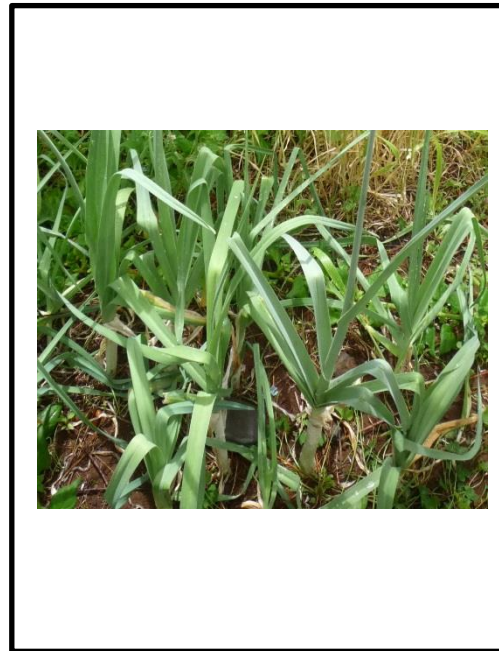
Desenvolvimento da planta